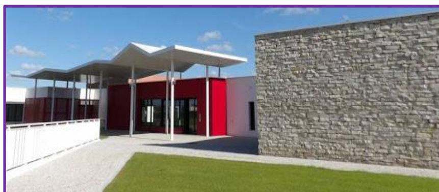
Entrée du Vill'Âges à Dompierre

Le siège social est situé au Vill'Âges rue Pierre de Coubertin à Dompierre-sur-Mer (17139).