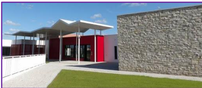
Entrée du Vill'âge à Dompierre

Le siège social est situé au « Vill'âges » rue Pierre de Coubertin 17139 Dompierre sur mer.