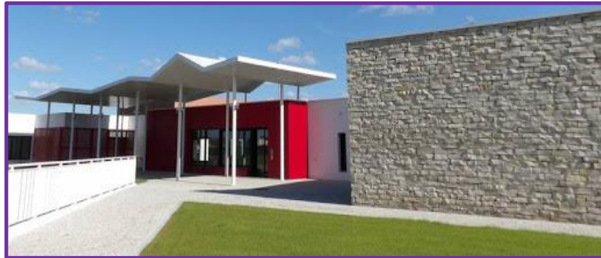
Entrée du Vill'âge à Dompierre

Le siège social est situé au « Vill'âges » rue Pierre de Coubertin 17139 Dompierre sur mer.