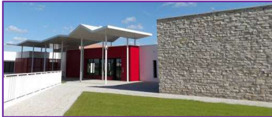
Entrée du Vill'âge à Dompierre

Le siège social est situé au « Vill'âges » rue Pierre de Coubertin 17139 Dompierre sur mer.